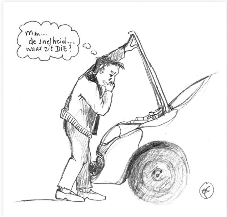
fig. 1-3 Tja, dat is zoeken

aannames gaan over de uiterlijke kant van gedrag en geest, en niet per se over de verborgen oorzaken. Dat is een algemeen probleem: begrippen die een zichtbaar resultaat beschrijven worden opgevat als ook geldig voor de oorzaak. Dat is zelden nuttig of überhaupt correct. Net zoals als wanneer de eigenaar van een futloze auto de motorkap zou opendoen op zoek naar de snelheid, om te zien of die soms zichtbare schade vertoont... (fig. 1-3)